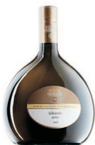
Müller-Thurgau Franken (Abbildung ähnlich)

fördert den Neubau der Kirchenorgel von St. Georg