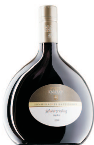
Domina Franken (Abbildung ähnlich)

enthält 1,50 € Spende an den Förderverein